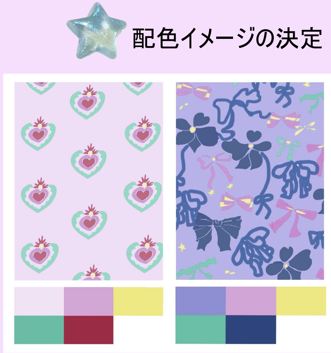
★ 配色イメージの決定