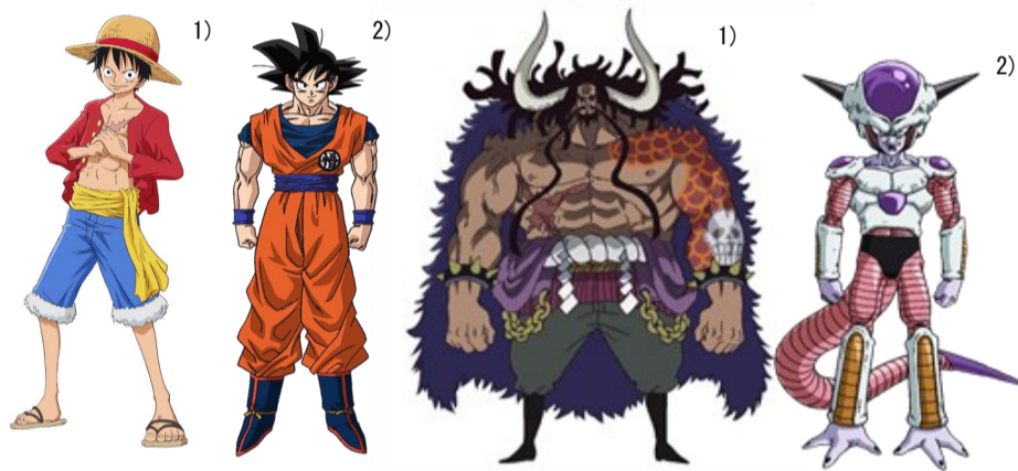
図1 主人公キャラクター例

多様な作品がある中で、アニメに登場するキャラクターは一貫して、着用している服装の色彩やデザイン、表情や体型で性格が類推出来る必要がある。例えば主人公は、図1のように赤やオレンジの服を着用しており、それらで勇敢さや強さを表現し、悪役・敵対するキャラクターは、図2のように黒や紫のコスチュームを身に付けており、それらで悪のイメージやキツさ、恐ろしさを表現していると類測出来る。