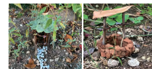
【写真5】人気のあった作品