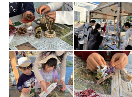
【写真6】ワークショップ開催

本企画では、1年かけた採集を行い、自然をベースにものづくりを行った。星が丘テラスの花壇を活用した展示や1日ぼたるんアレンジワークショップを通して、ぼたるんの暮らしや星が丘テラスの取り組みについて少しでも多くの人に伝えることができたと思う。