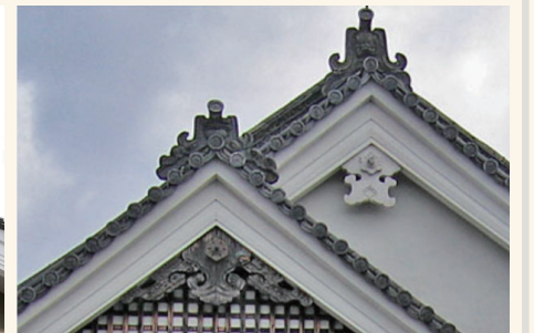
【図10】今西家住宅 / 奈良県橿原市