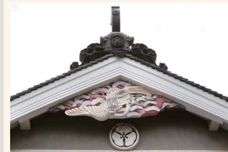
【図9】本芳我家住宅 / 愛媛県喜多郡