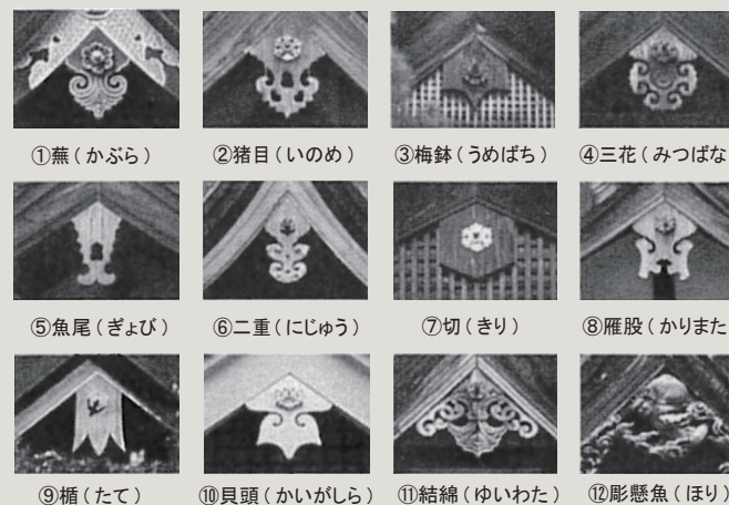
【図2】懸魚の種類 / 「懸魚（げぎょ）：懸魚の形態と意匠の移り変わり」より

「懸魚（げぎょ）：懸魚の形態と意匠の移り変わり」 懸魚の意匠の形態を①蕪懸魚、②猪目懸魚、③梅鉢懸魚、④三花懸魚、⑤魚尾懸魚、⑥二重懸魚、⑦切懸魚、⑧雁股懸魚、⑨楯懸魚、⑩貝頭懸魚、⑪結綿懸魚、⑫彫懸魚の12種類に分類されていた。