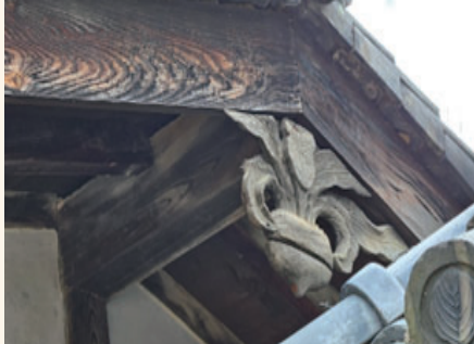
【図4】馬場家住宅 懸魚

本棟造の主屋に豪華な蕪懸魚が取り付けられていた。実際に近くで見た懸魚は、とても迫力があり、鱗に施された彫刻がとても手が込んでいて美しかった。また、主屋には野菜の蕪の形をした可愛らしい彫懸魚が取り付けられていた。