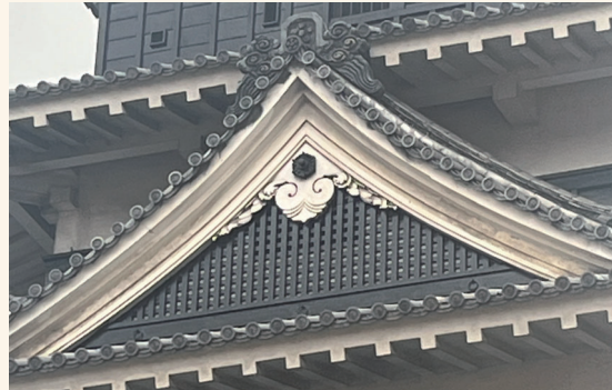
【図1】松本城に取り付けられた蕪懸魚