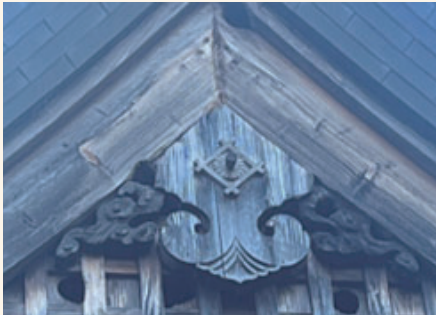
【図6】江川家住宅 懸魚

江川家住宅には、1つの懸魚を確認する事が出来た。懸魚自体の形態は蕪懸魚とベーシックな形だが、六葉の部分には江川家の家紋が施されていた。