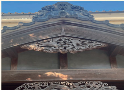
【図5】松城家住宅 懸魚

松城家住宅の懸魚は、鶴の彫刻が施されており、他の住宅に取り付けられている懸魚と見比べても緻密で迫力があつた。また、亀の彫刻が施された欄間の透かし彫は、存在感があり、美しかった。