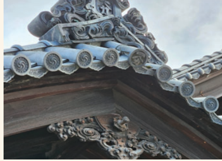
【図3】旧林家住宅 懸魚

旧林家住宅には、計3つの懸魚を確認する事が出来た。1つ目は、主屋の玄関に取り付けられた彫懸魚。とても繊細な波しぶきのデザインが彫刻で施されており、手が込んでいた。