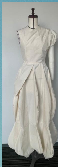
『Ad imo pectore』