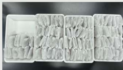
お茶パックに詰める