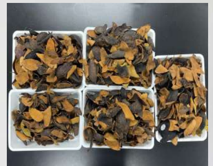
アボカド 200個分 の皮を砕く