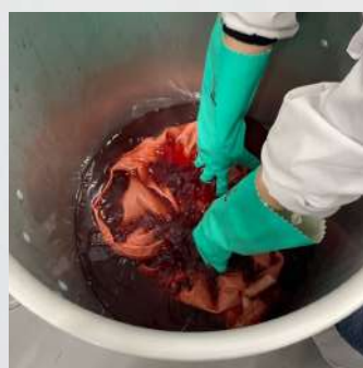
クエン酸を加える